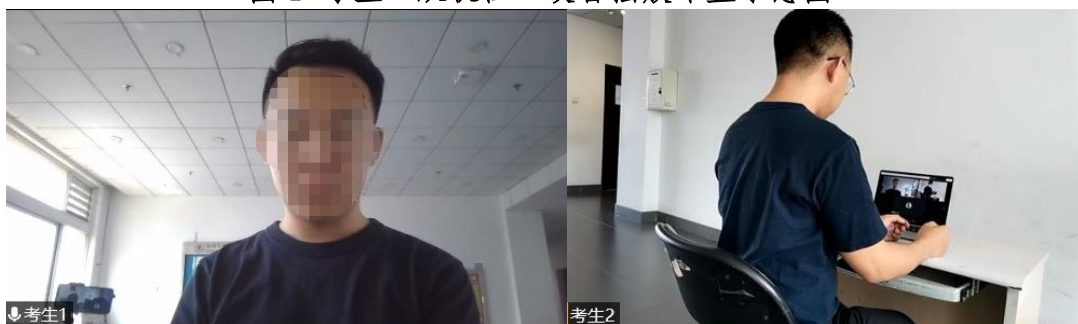
图2 “双机位”镜头显示的考生画面

4. 考生面试时正对摄像头保持坐姿端正，双手和头部完全呈现在复试专家可见画面中，不得佩戴口罩，保证面部清晰可见，头发不可遮挡耳朵，不得佩戴耳机和耳饰。