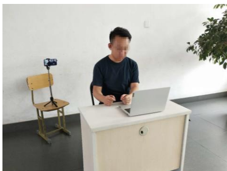
图1 考生“双机位”设备摆放布置示意图